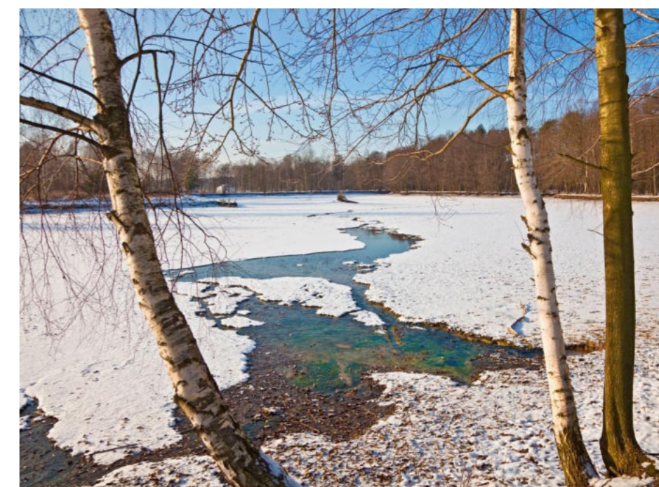
Orzeskie stawy / Teiche in Orzesze