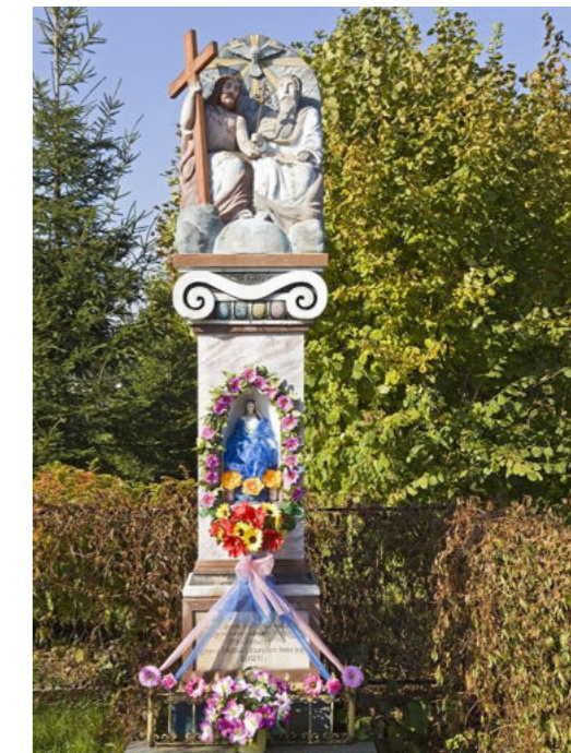
Figura kolumnowa w Zazdrości/ Säulenfigur in Zazdrości