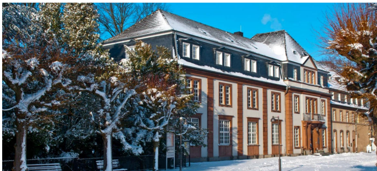
Meisterschule für Augenoptiker in Knechtsteden / Szkoła dla mistrzów w zawodzie optyków