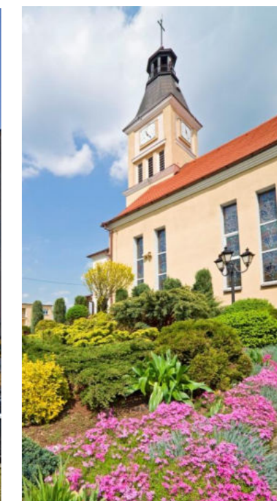
Kościół w sołectwie Zgoń / Kirche im Dorf Zgoń