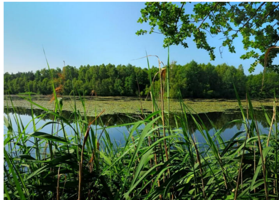
Staw Pasieki w sołectwie Zawiesz / Teich Pasieki im Dorf Zawiesz