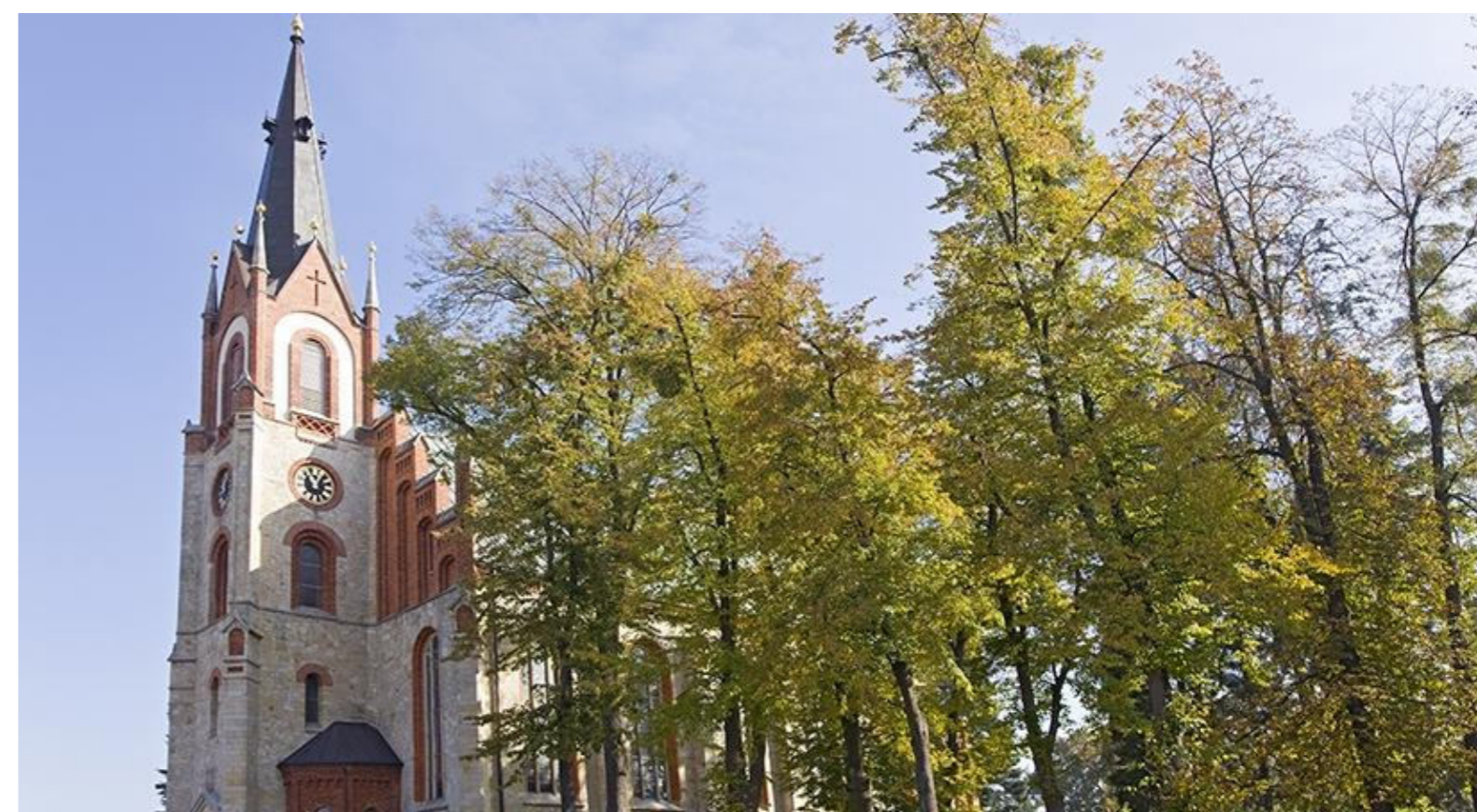
Kościół parafialny pw. św. Apostołów Piotra i Pawła w Woszczycach/Kirche St. Petrus und Paulus die Apostel in Woszczycach