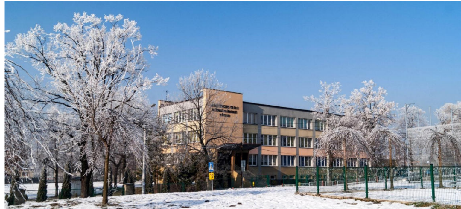
Szkoła Podstawowa nr 2 im. S. Moniuszki w Orzeszu / S. Moniuszko Grundschule Nr. 2 in Orzesze