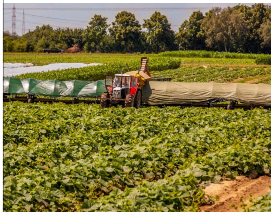
Gurkenernte in Horrem / Zbiór ogórków w Horrem