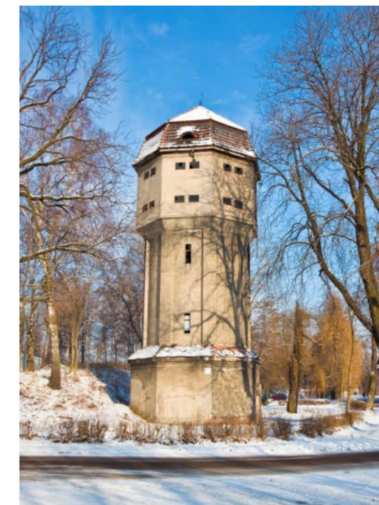
Zabytkowa wieża ciśnienia w Orzeszu / Historischer Wasserturm in Orzesze