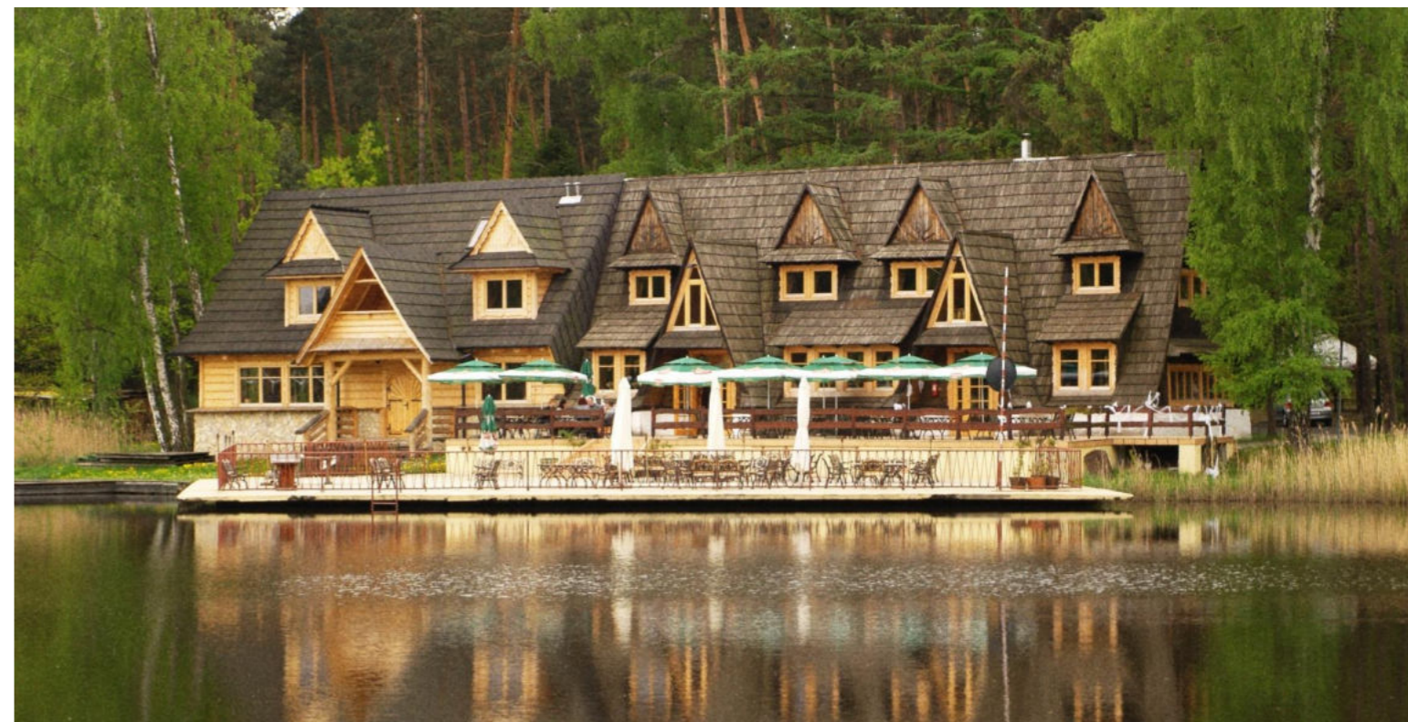
Kompleks wypoczynkowy BARON w sołectwie Woszczyce / BARON Ferienkomplex im Dorf Woszczyce