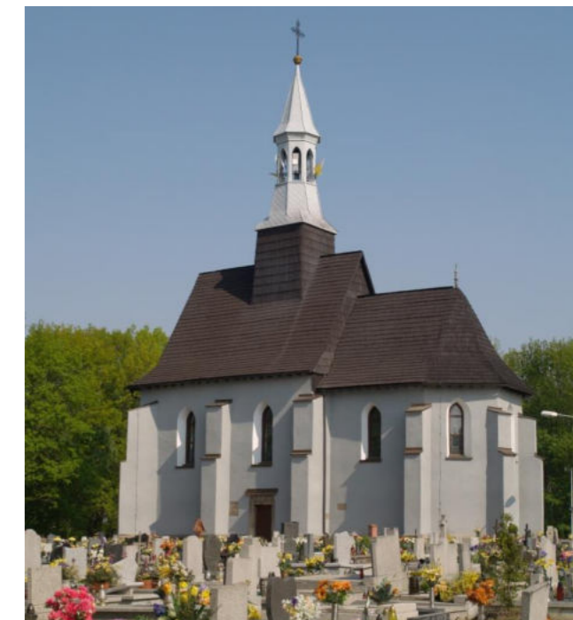
Kościół św. Wawrzyńca w Orzeszu / Kirche des Heiligen Laurentius in Orzesze