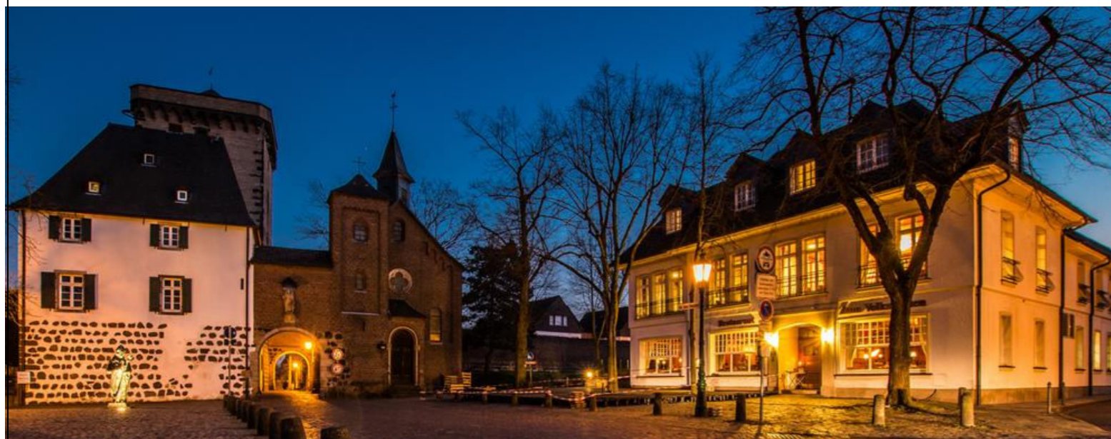
Rheintor in Zons / Historyczna brama w Zons