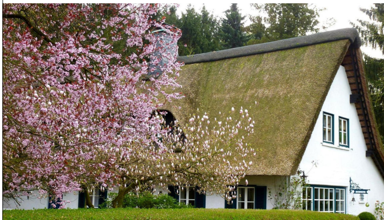
Altes Forsthaus Hackenbroich / Stara leśniczówka w Hackenbroich