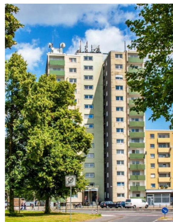
Heesenstraße in Horrem/ Ulica Heesen w Horrem