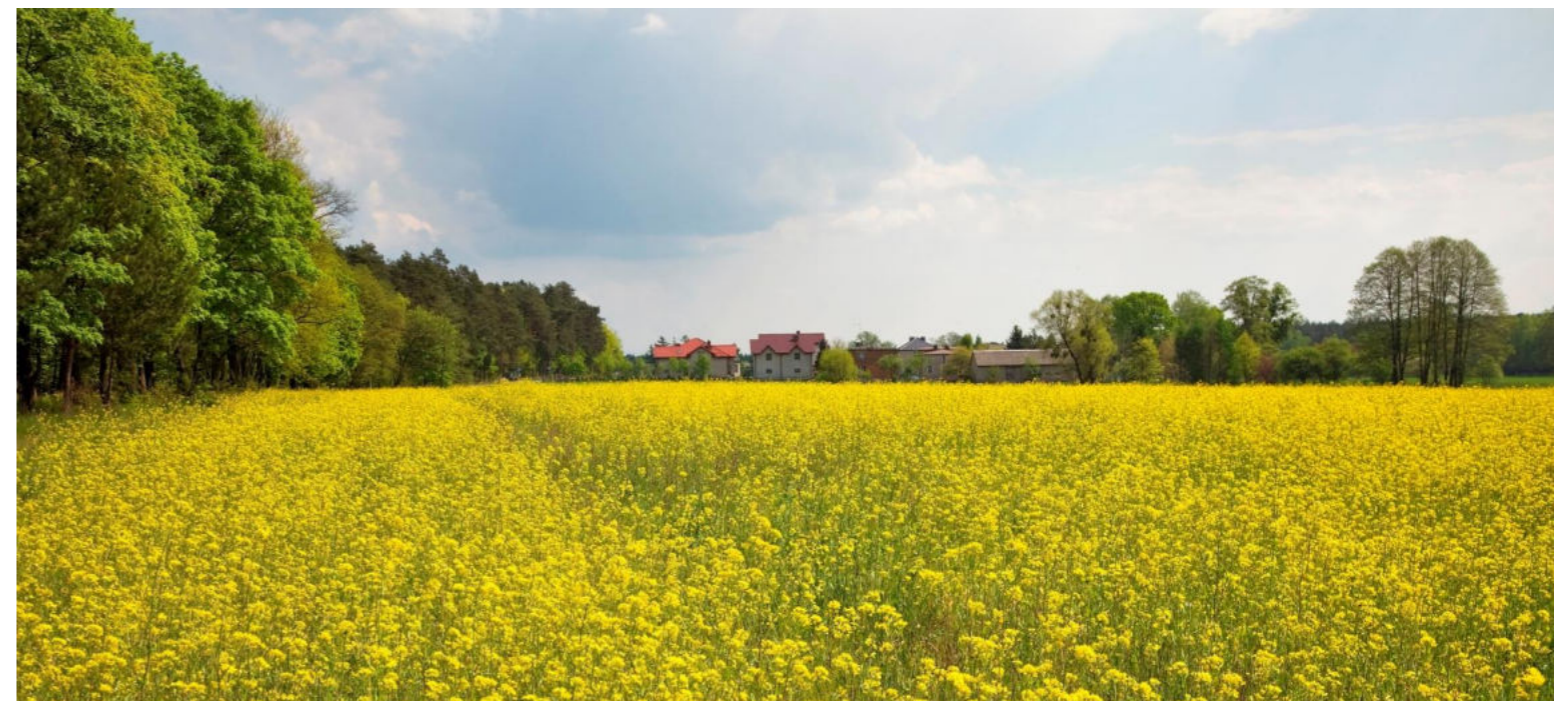
Łany rzepaku na terenach rolnych Orzesza / Rapsfelder in den landwirtschaftlichen Gebieten von Orzesze