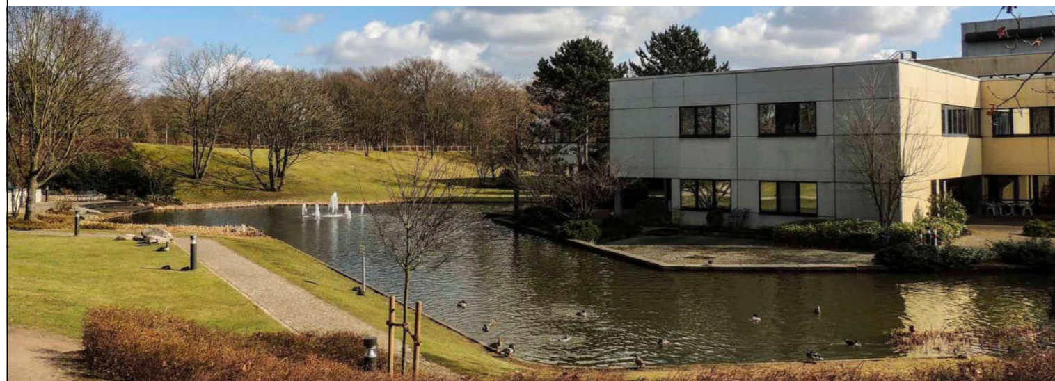
Krankenhaus Hackenbroich / Szpital Hackenbroich