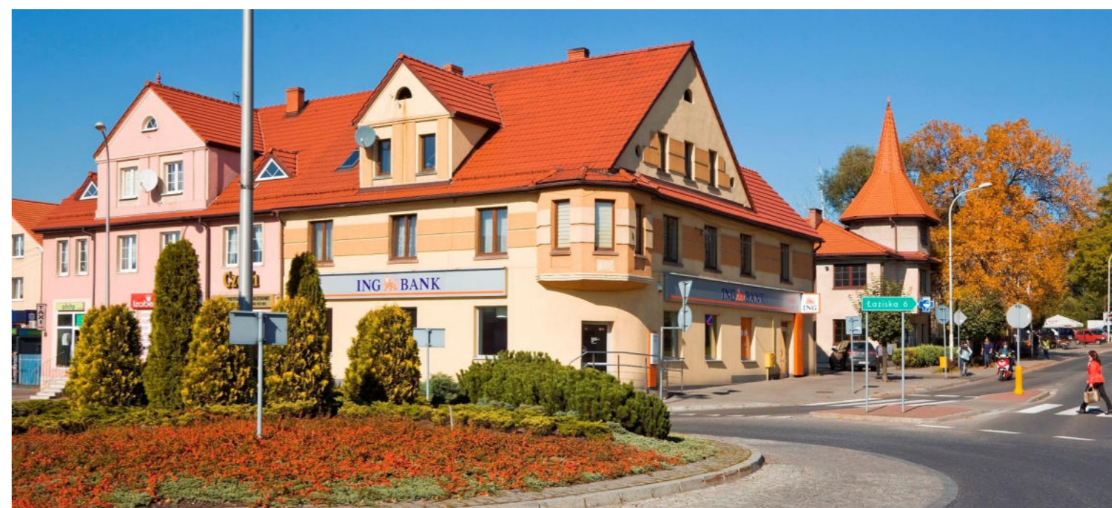
Rondo Powstańców Śląskich / Kreisverkehr der schlesischen Aufständischen