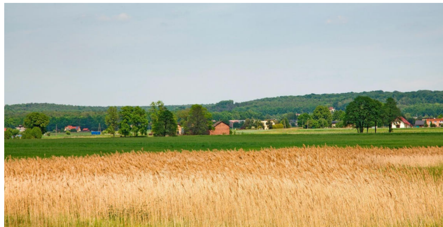
Pola uprawne w sołectwie Zawisz / Ackerflächen im Dorf Zawisz