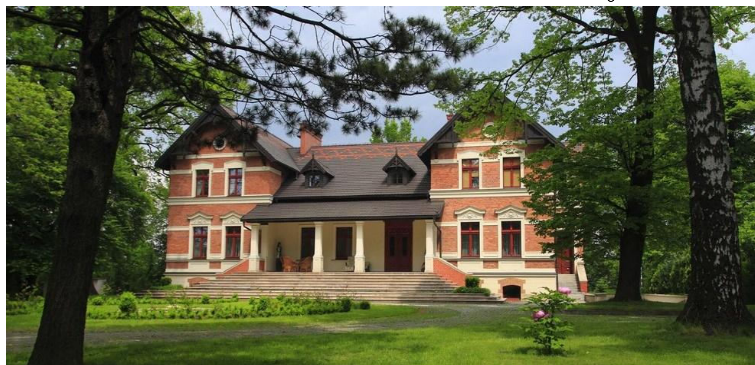
Zespół dworsko-parkowy w sołectwie Gardawice / Der Herrenhaus- und Parkkomplex im Dorf Gardawice