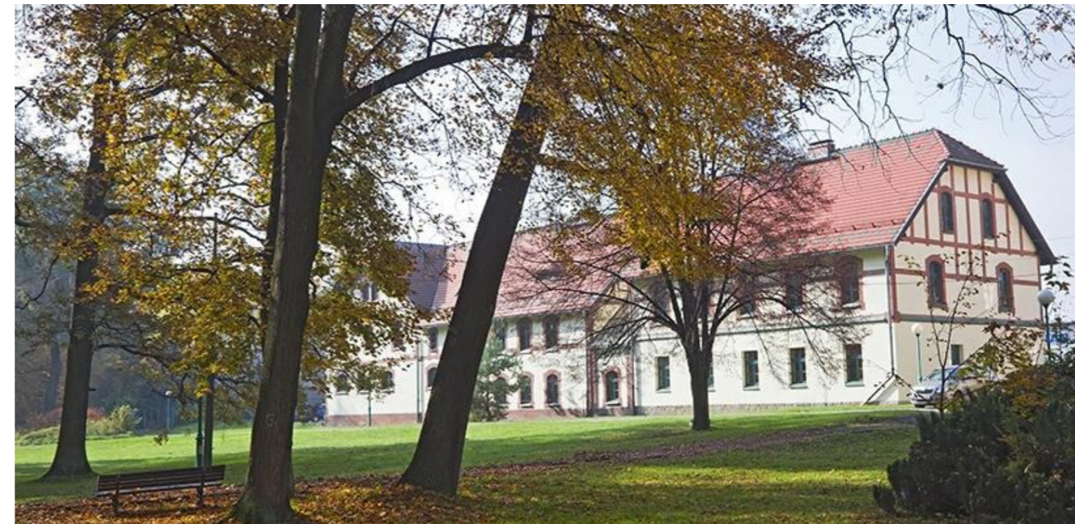
Zespół zabudowy barokowego pałacu z XVIII w. w sołectwie Zawieść Komplex barocker Palastgebäude aus dem 18. Jahrhundert im Dorf Zawieść