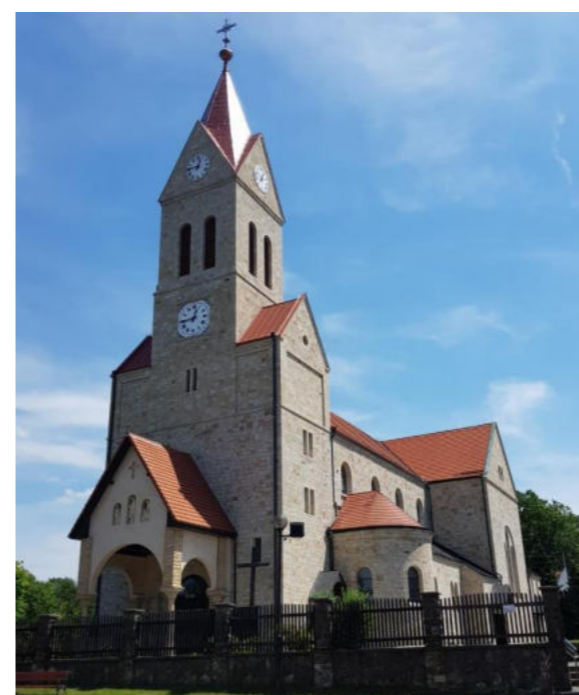
Kościół pw. Nawiedzenia NMP w Orzeszu / Kirche der Heiligen Jungfrau Maria in Orzesze