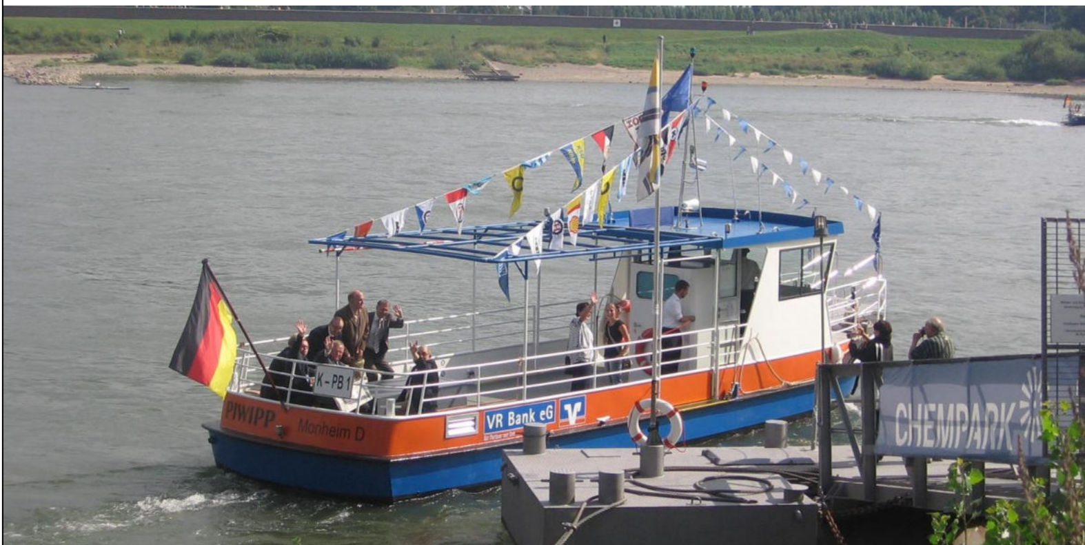
Fußgängerfähre Piwipp / Prom dla pieszych Piwipp