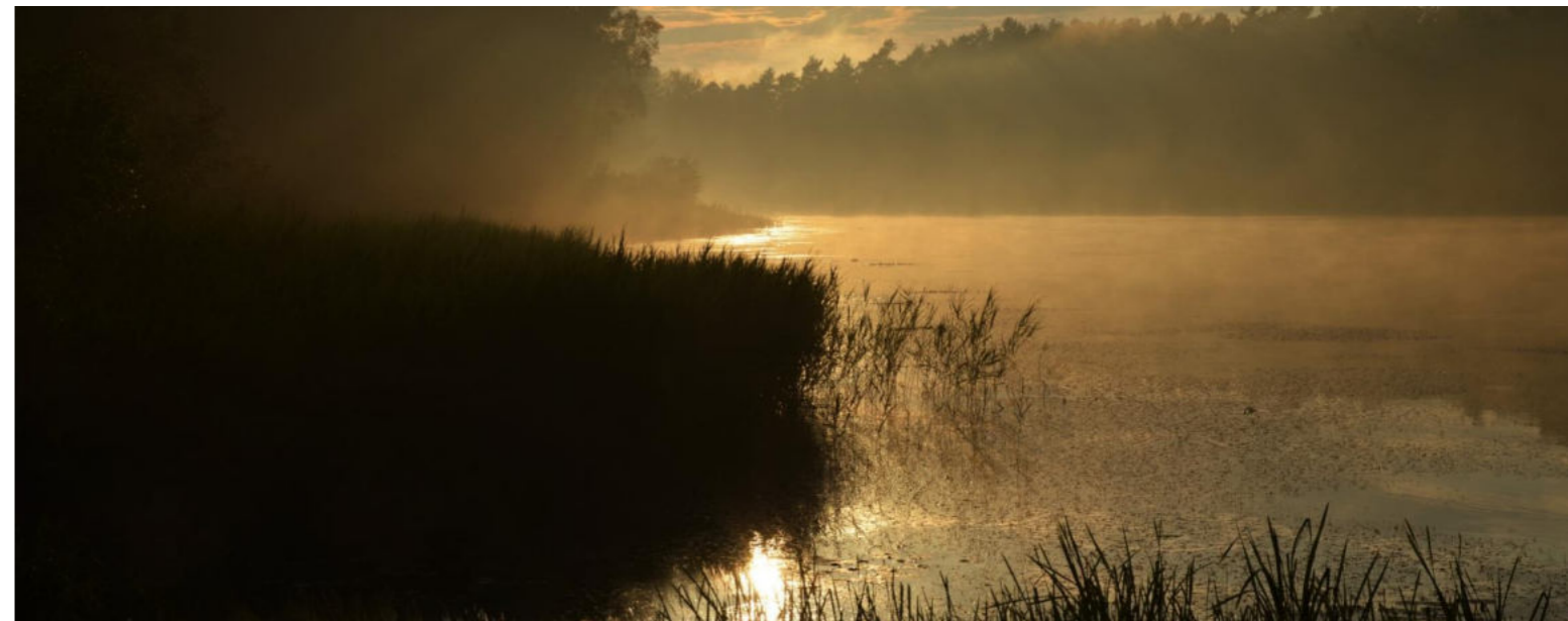
Staw Zarzyna w sołectwie Woszczyce / Teich Zarzyna im Dorf Woszczyce