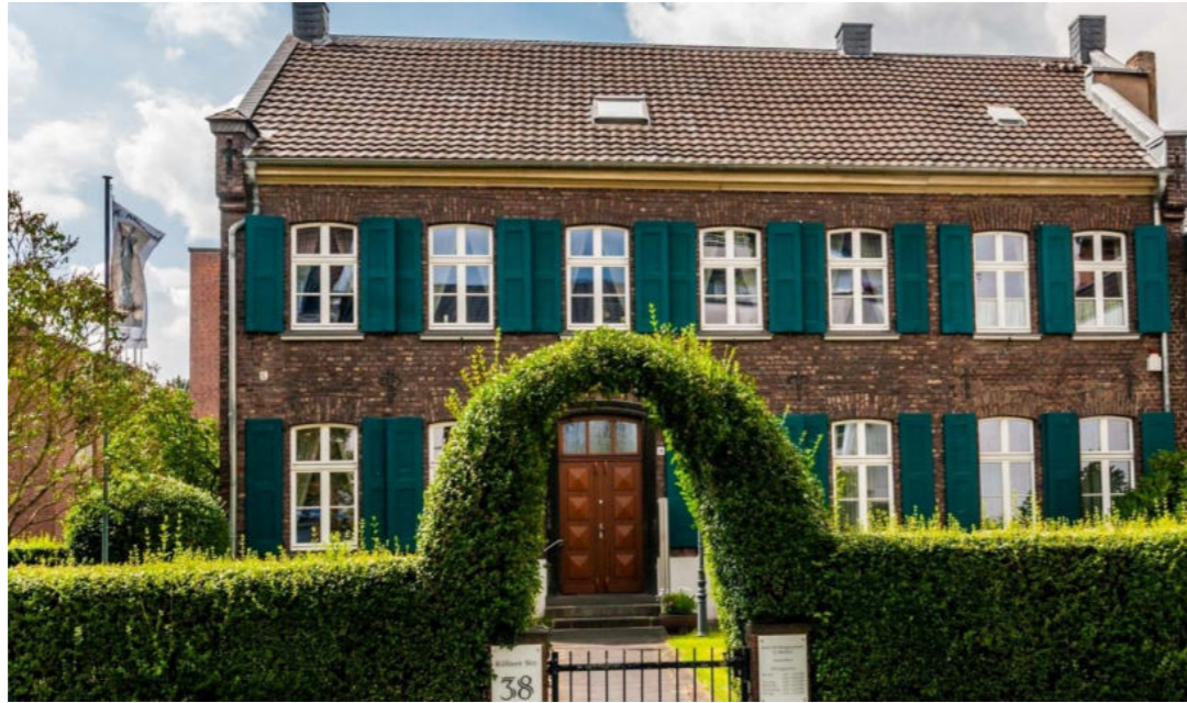
Pfarrhaus von St. Michael / Probostwo św. Michała