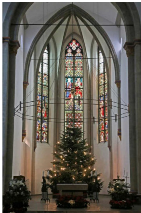
Altar der Basilika / Ołtarz w Bazylice