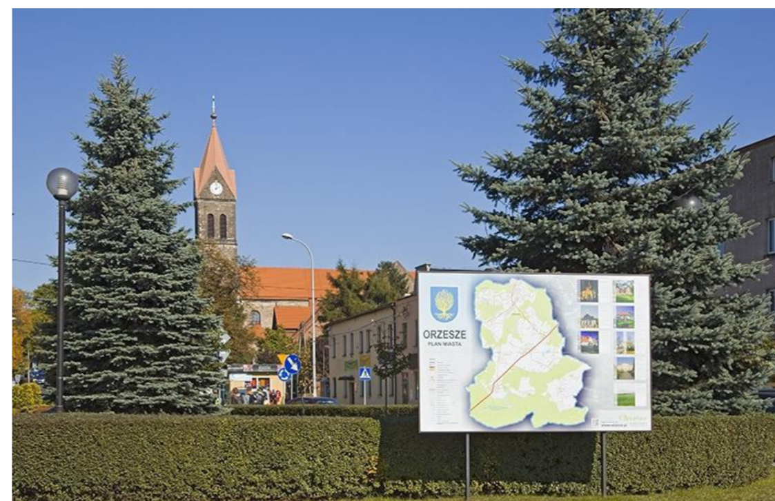
Centrum Orzesza / Zentrum von Orzesze