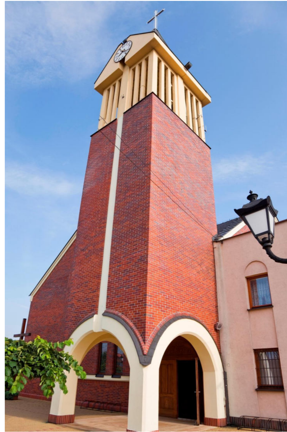
Kościół pw. Miłosierdzia Bożego w sołectwie Zazdrość / Kirche Göttliche Barmherzigkeit in Zazdrości