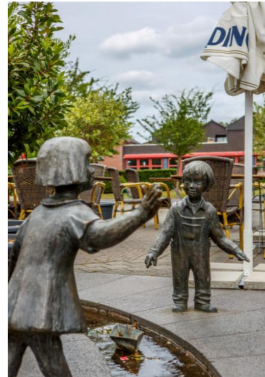
Salvatorplatz in Nievenheim Plac Salvator w Nievenheim