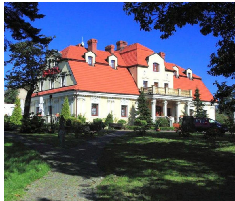
Pałacyk z XIX w. w sołectwie Woszczyce/ Ein Palast aus dem 19. Jahrhundert im Dorf Woszczyce