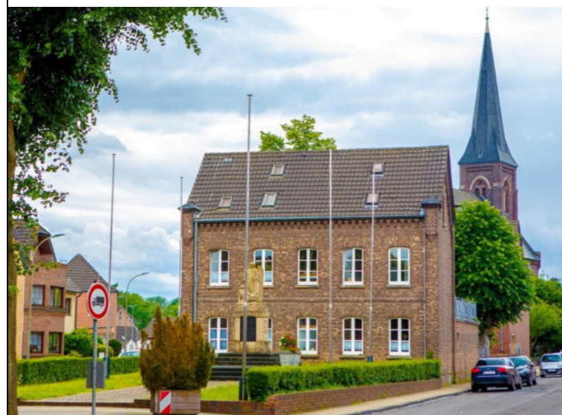
Denkmal am Lindenkirchplatz / Pomnik na placu kościelnym