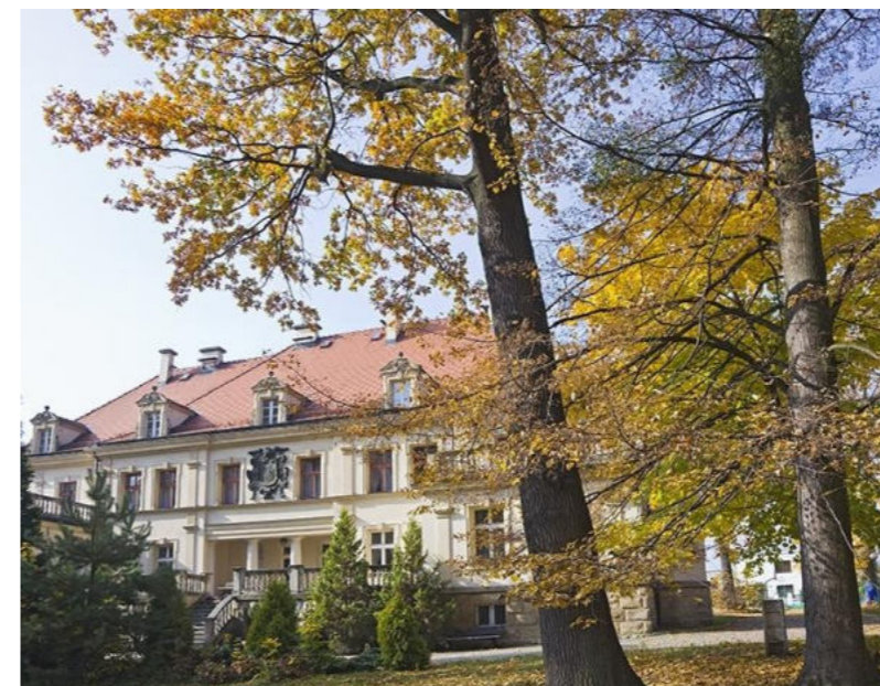
Barokowy pałac z parkiem z XVIII w. w sołectwie Zawieszka Barockpalast mit Park aus dem 18. Jahrhundert im Dorf