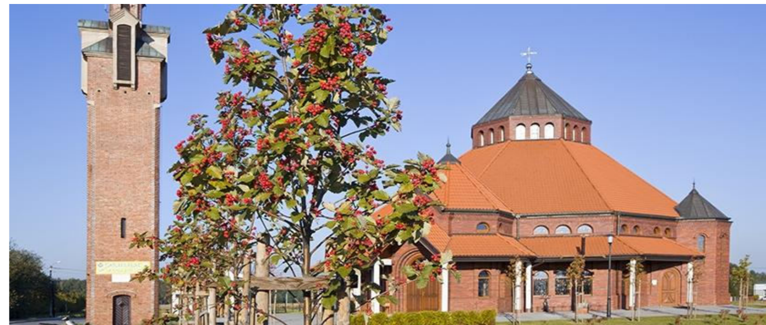
Kościół pw. Męczeństwa św. Jana Chrzciciela w Zawiści / Kirche Martyrium des Heiligen Johannes der Täufer in Zawiści