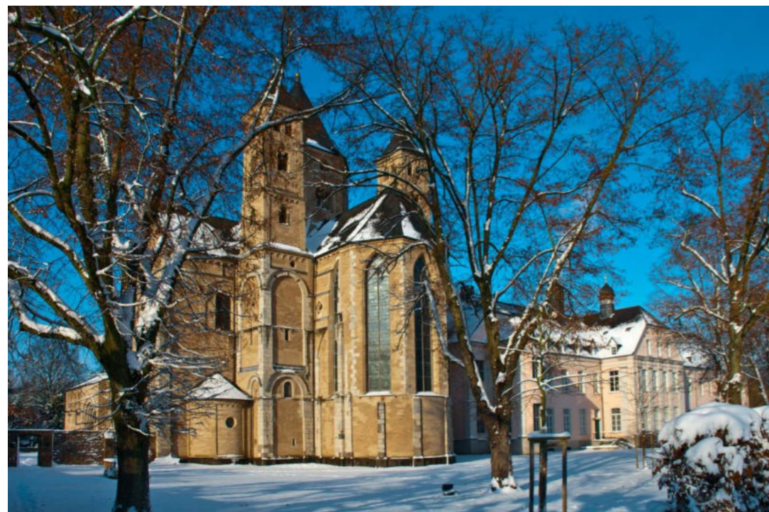
Basilika Knechtsteden / Bazylika Knechtsteden