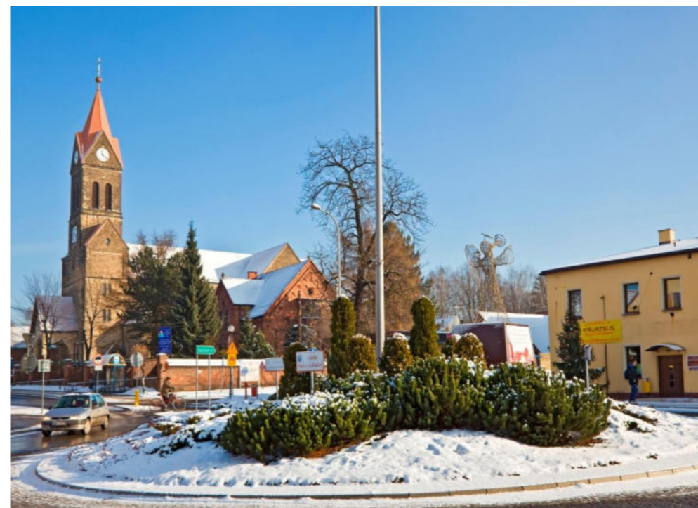
Rondo Powstańców Śląskich i MOK Orzesze / Kreisverkehr der schlesischen Aufständischen und Stadtkulturzentrum Orzesze