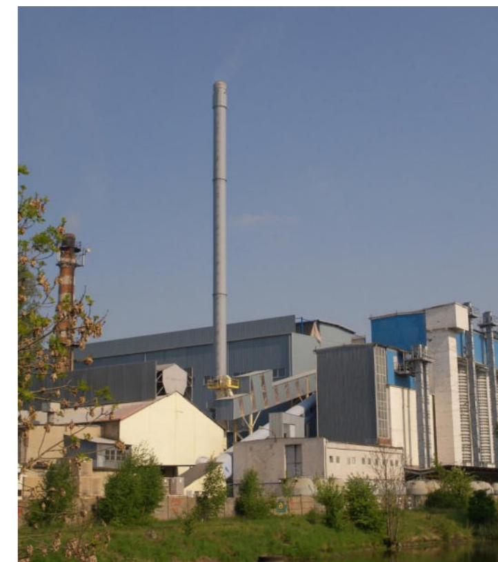
Huta Szkła „Orzesze” / Glashütte Orzesze