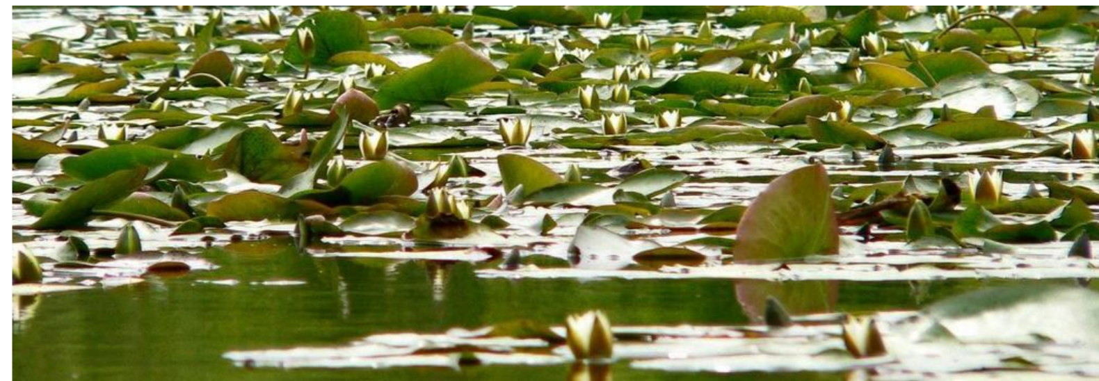
Nenufary na orzeskich stawach / Seerosen auf den Teichen in Orzesze