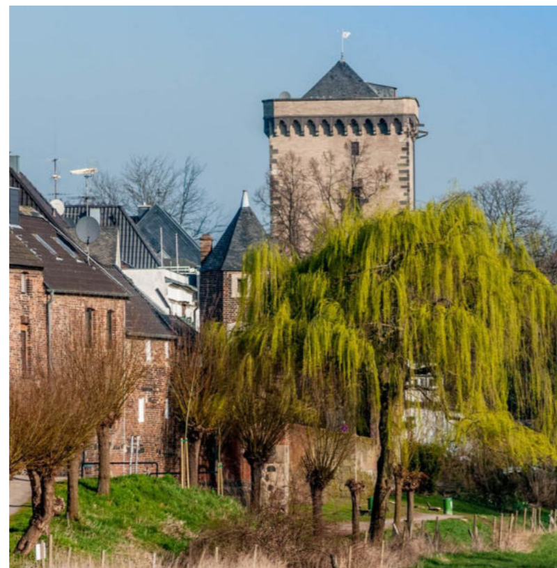
Silhouette von Zons/ Widok na Zons