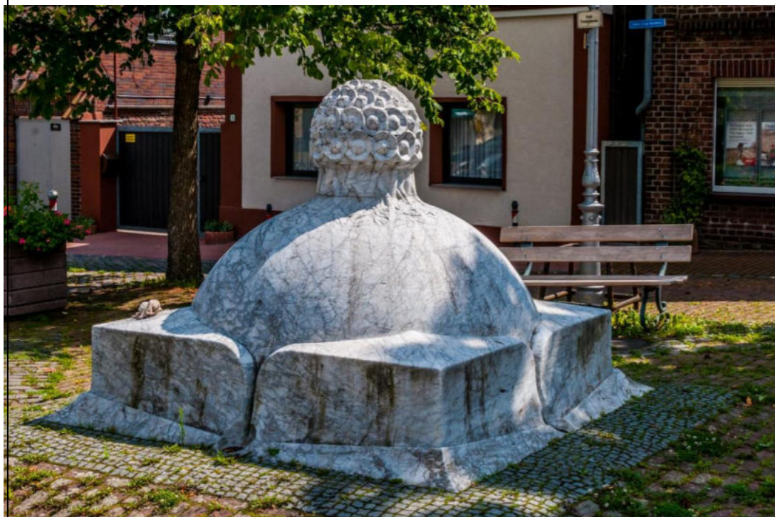
Odilienbrunnen in Gohr/ Fontanna św. Odylii w Gohr