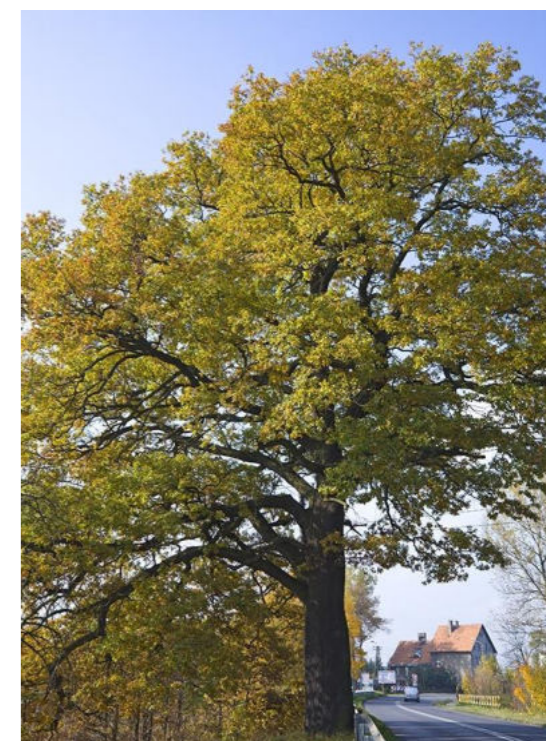
Dąb szypułkowy w sołectwie Zawieść / Stiel - Eiche im Dorf Zawieść