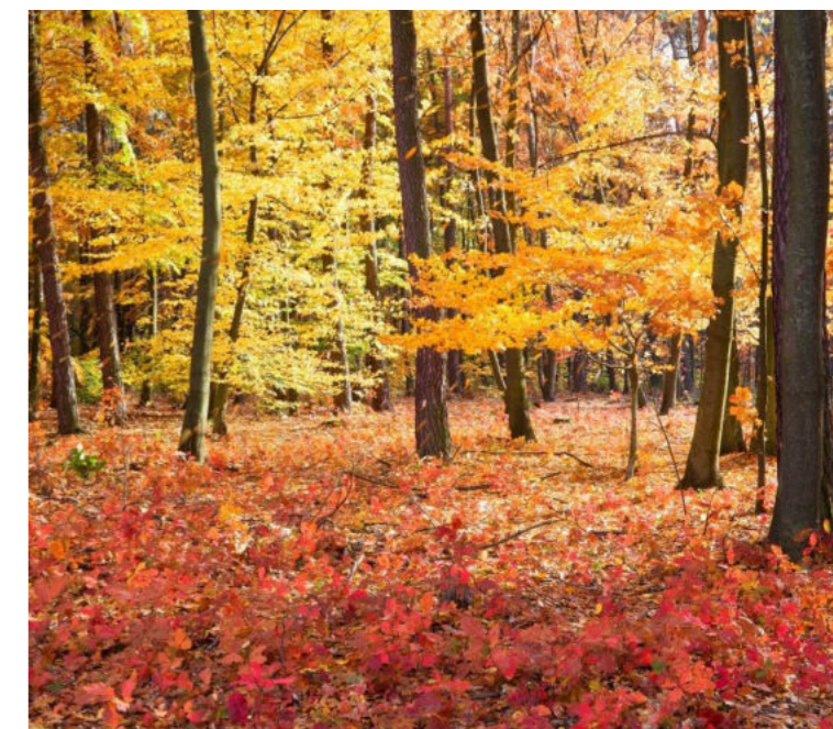
Jesienny las w Królówce / Herbstwald in Królówka