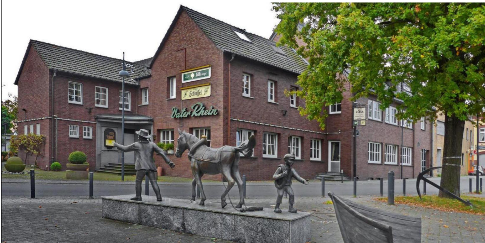
Treideldenkmal Stürzelberg / Pomnik Stürzelberg