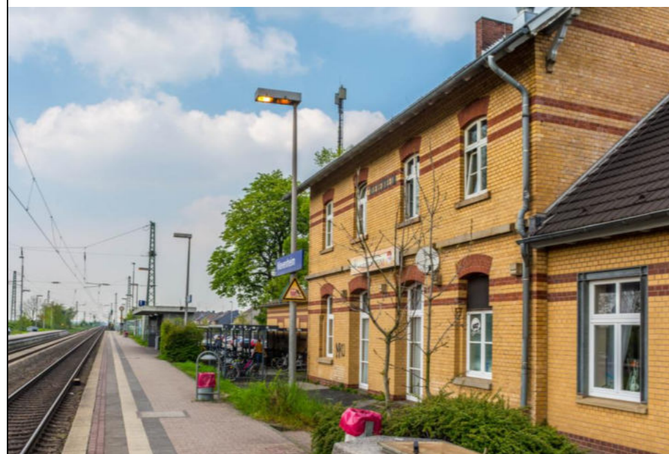
Bahnhof in Delrath / Dworzec w Delrath