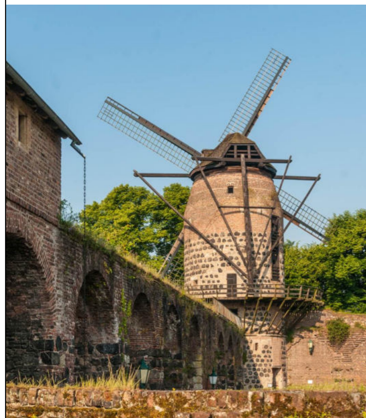
Historische Windmühle Zons / Historyczny wiatrak w Zons