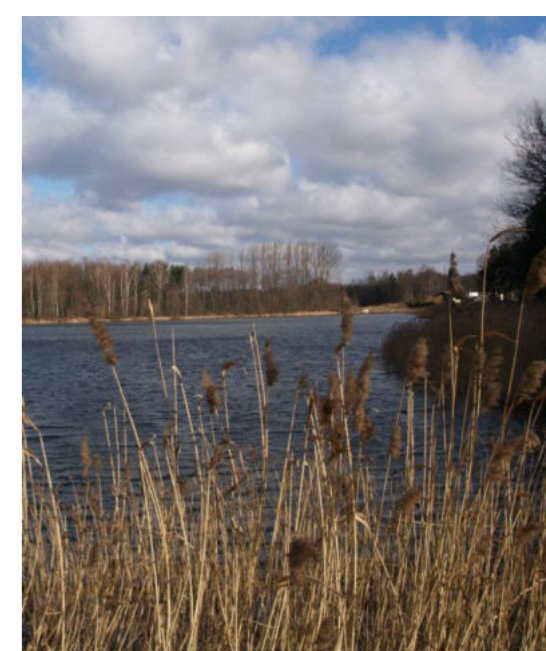
Staw Baraniok w sołectwie Woszczyce / Baraniok-Teich im Dorf Woszczyce