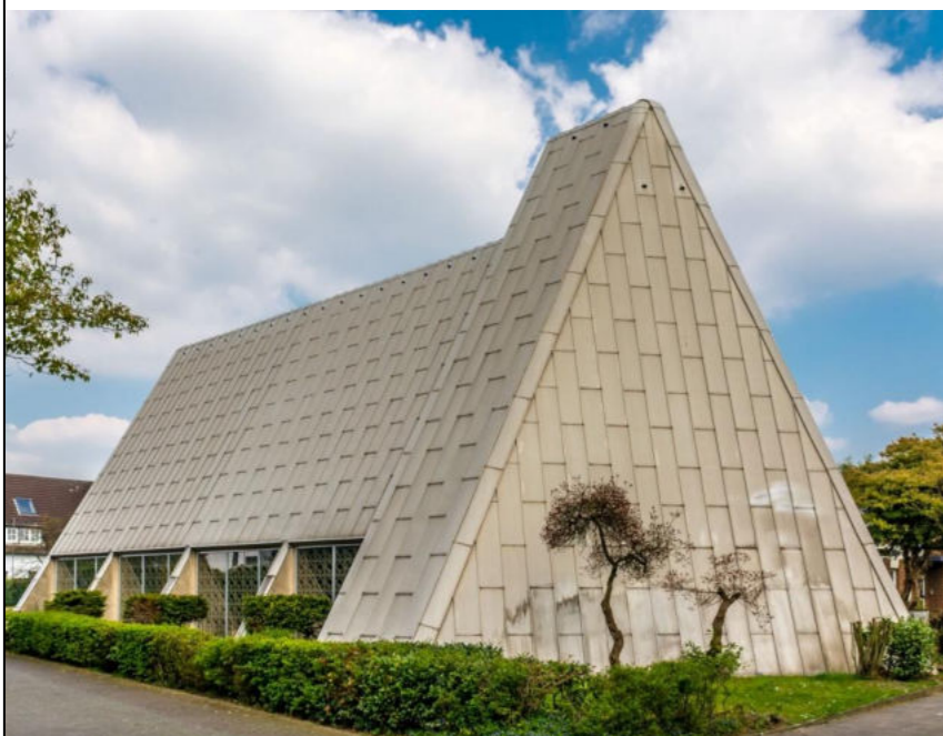
Evangelische Lukaskirche / Kościół ewangelicki