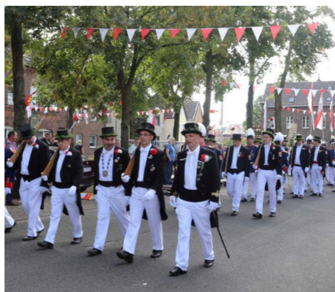
Schützenfest in Straberg / Pochód karabinierów w Straberg