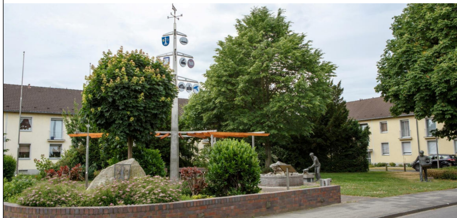
Dorfplatz in Delrath / Plac wiejski w Delrath