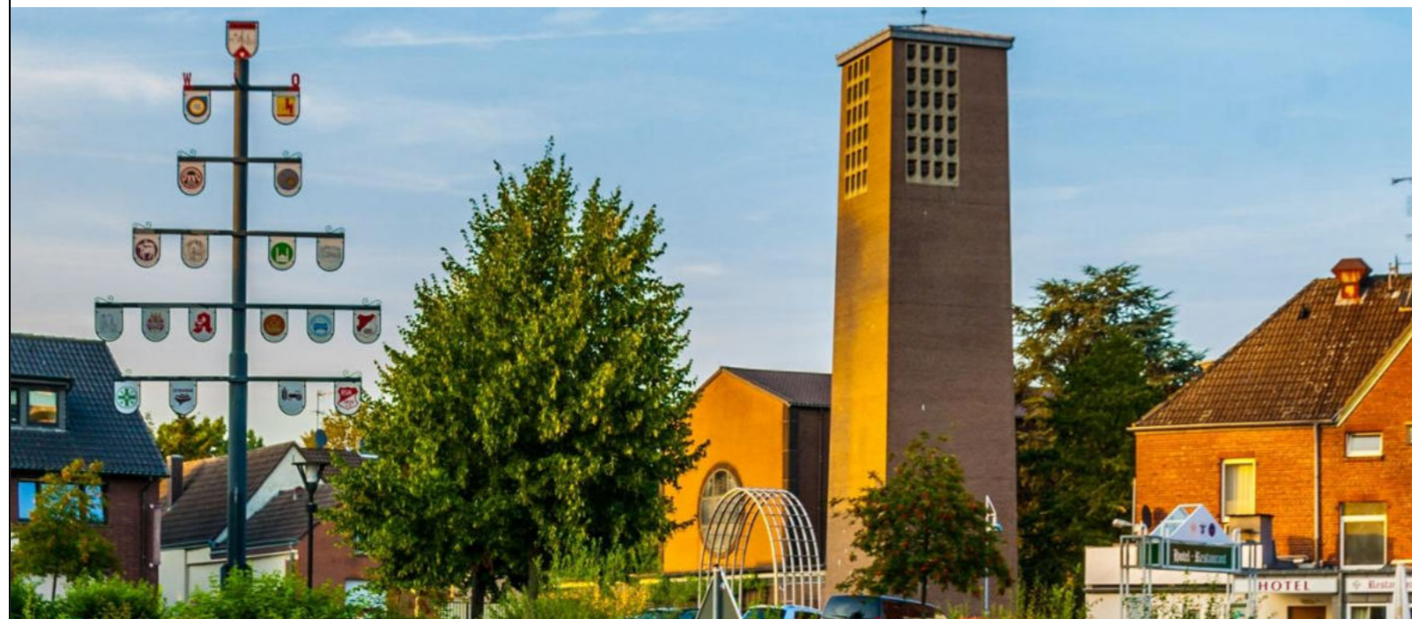
Dorfanger in Horrem / Plac wiejski w Horrem