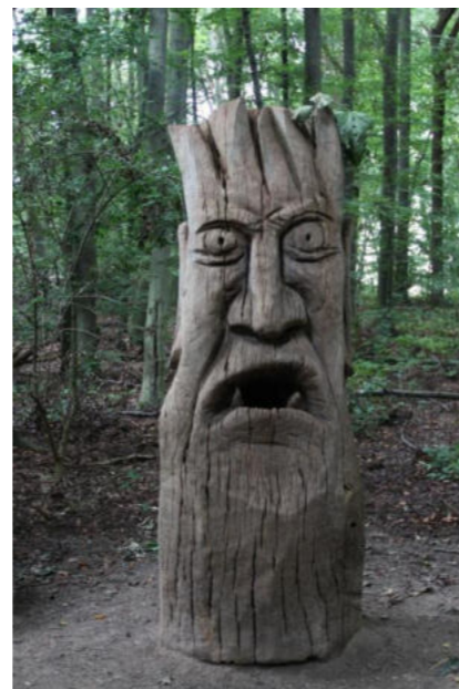
Skulptur Waldlehrpfad / Rzeźba na leśnym szlaku