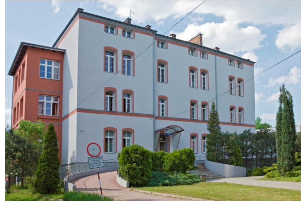
Budynek szpitala Chorób Płuc w Orzeszu Gebäude des Krankenhauses für Lungenkrankheiten in Orzesze