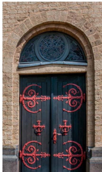
Kirchentür St. Odilia / Brama kościelna św. Odylii