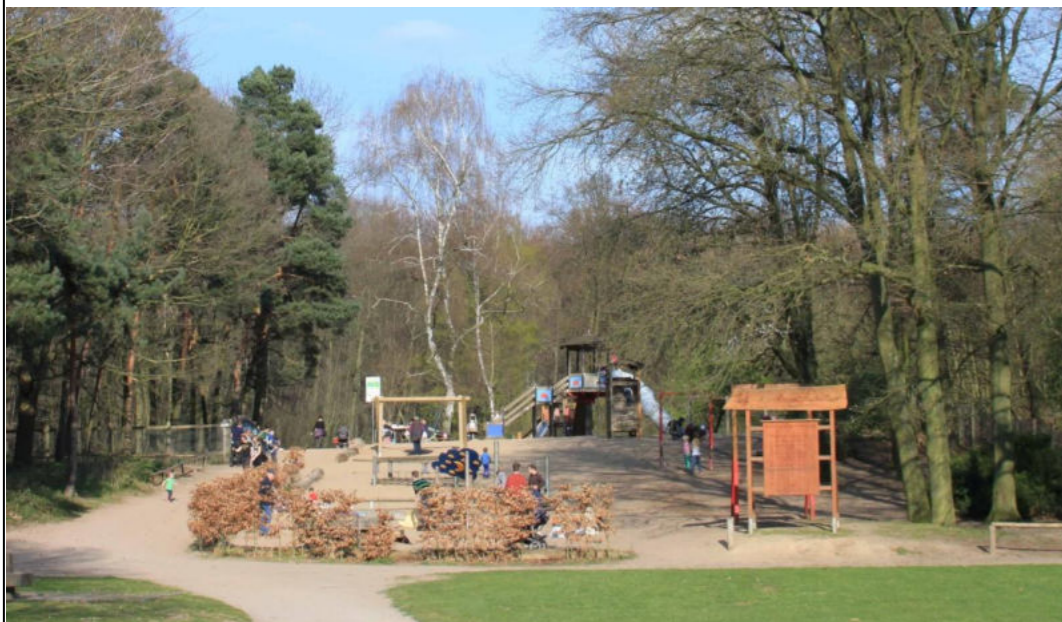
Spielplatz Tannenbusch / Plac zabaw Tannenbusch