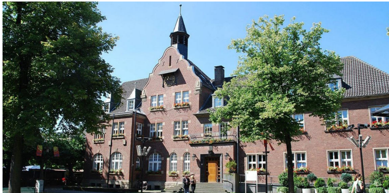
Altes Rathaus Dormagen / Historyczny ratusz Dormagen