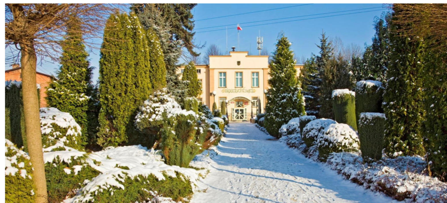
Skwer przed budynkiem Urzędu Miejskiego / Platz vor dem Rathausgebäude