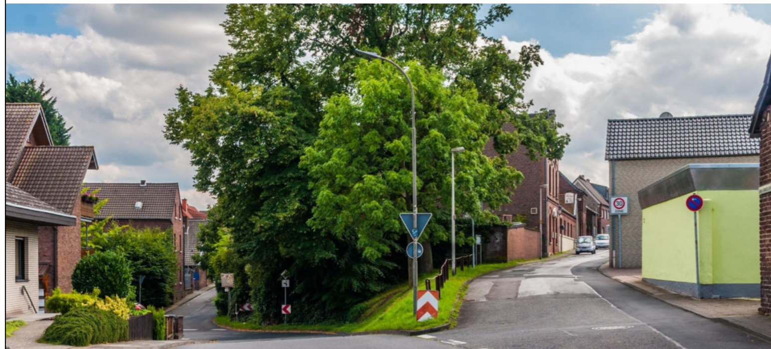
Ansicht „Bergdorf“ Gohr/ Widok "górska wioska" Gohr