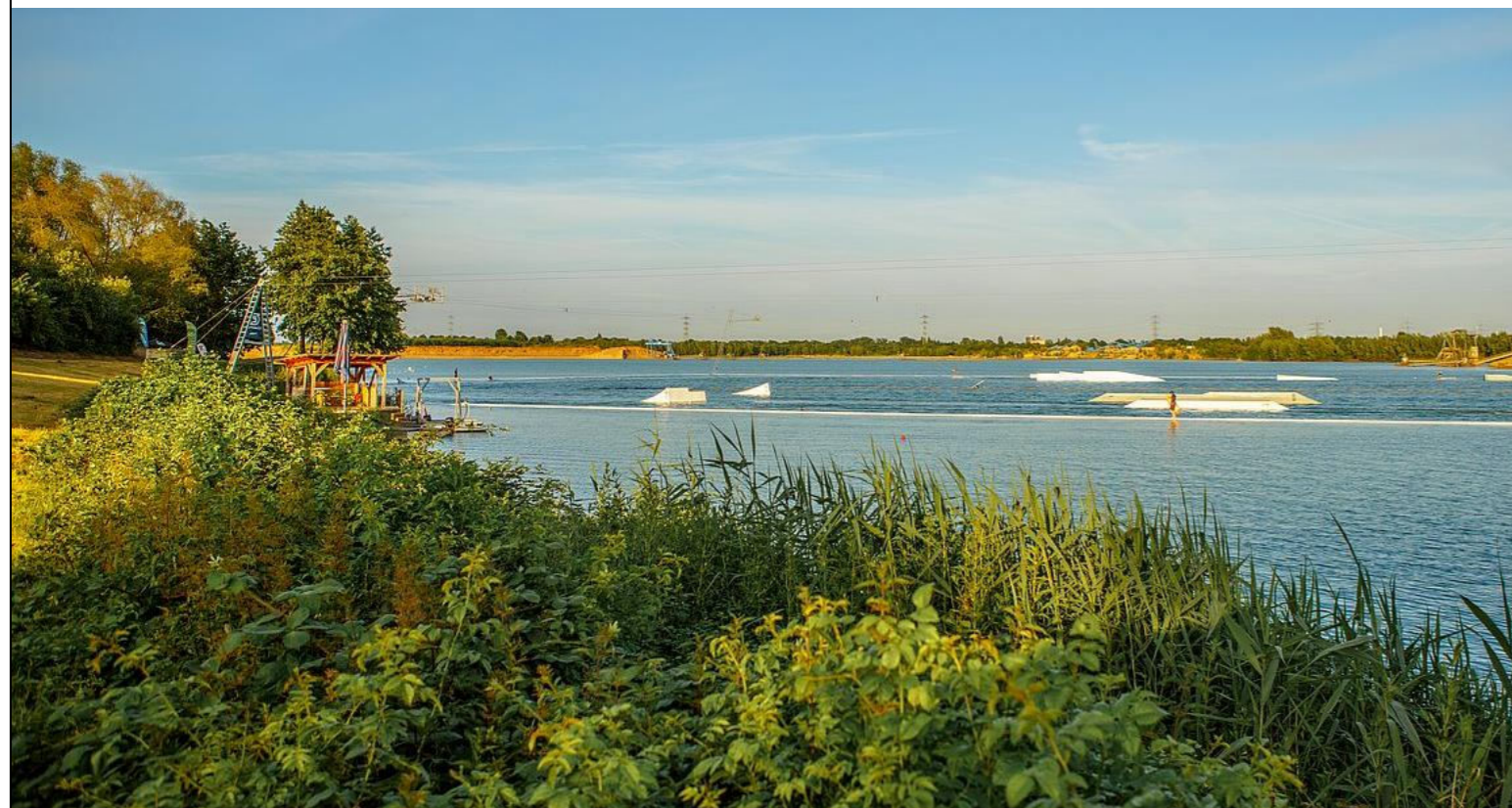
Straberger See / Jesioro w Straberg