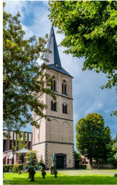
Kirchturm von St. Michael / Wieża kościoła św. Michała