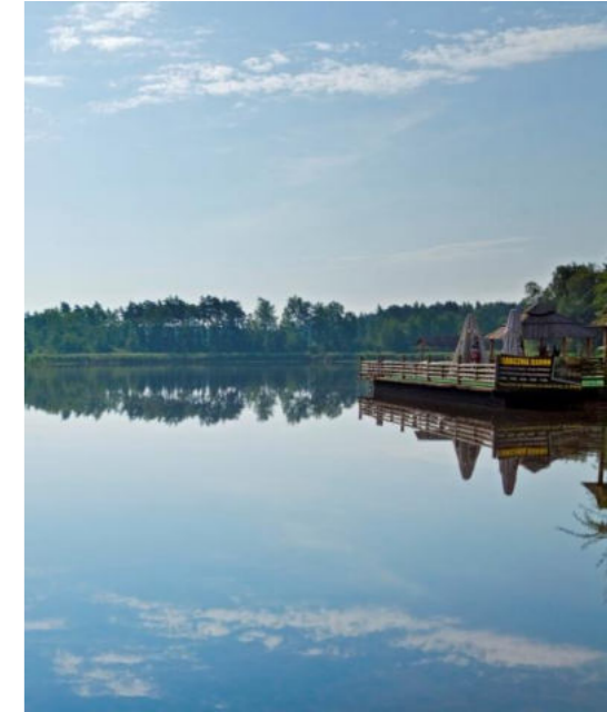
Staw w sołectwie Woszczyce Teich im Dorf Woszczyce