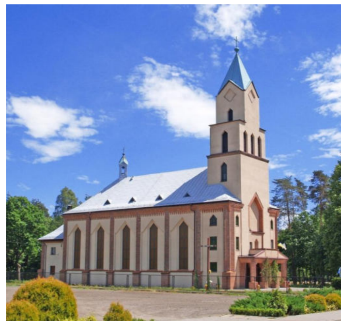
Kościół w Jaśkowicach / Kirche in Jaśkowitz