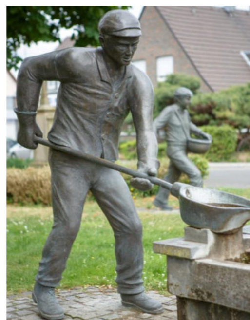
Denkmal Zinkgießer / Pomnik odlewacz cynku