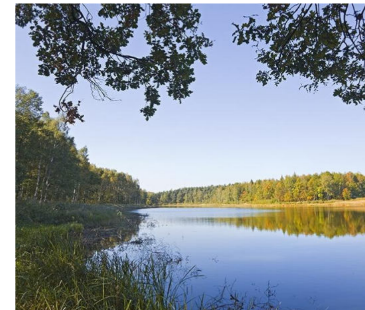
Staw Pasieki w sołectwie Zawieszka Teich Pasieki im Dorf Zawieszka