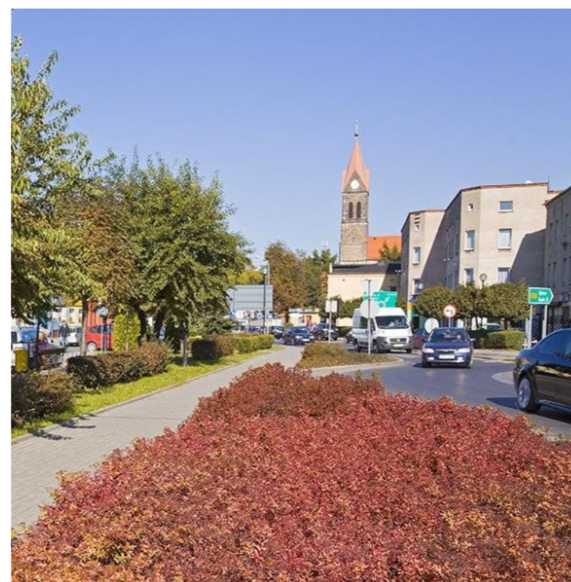
Centrum Orzesza / Zentrum von Orzesze