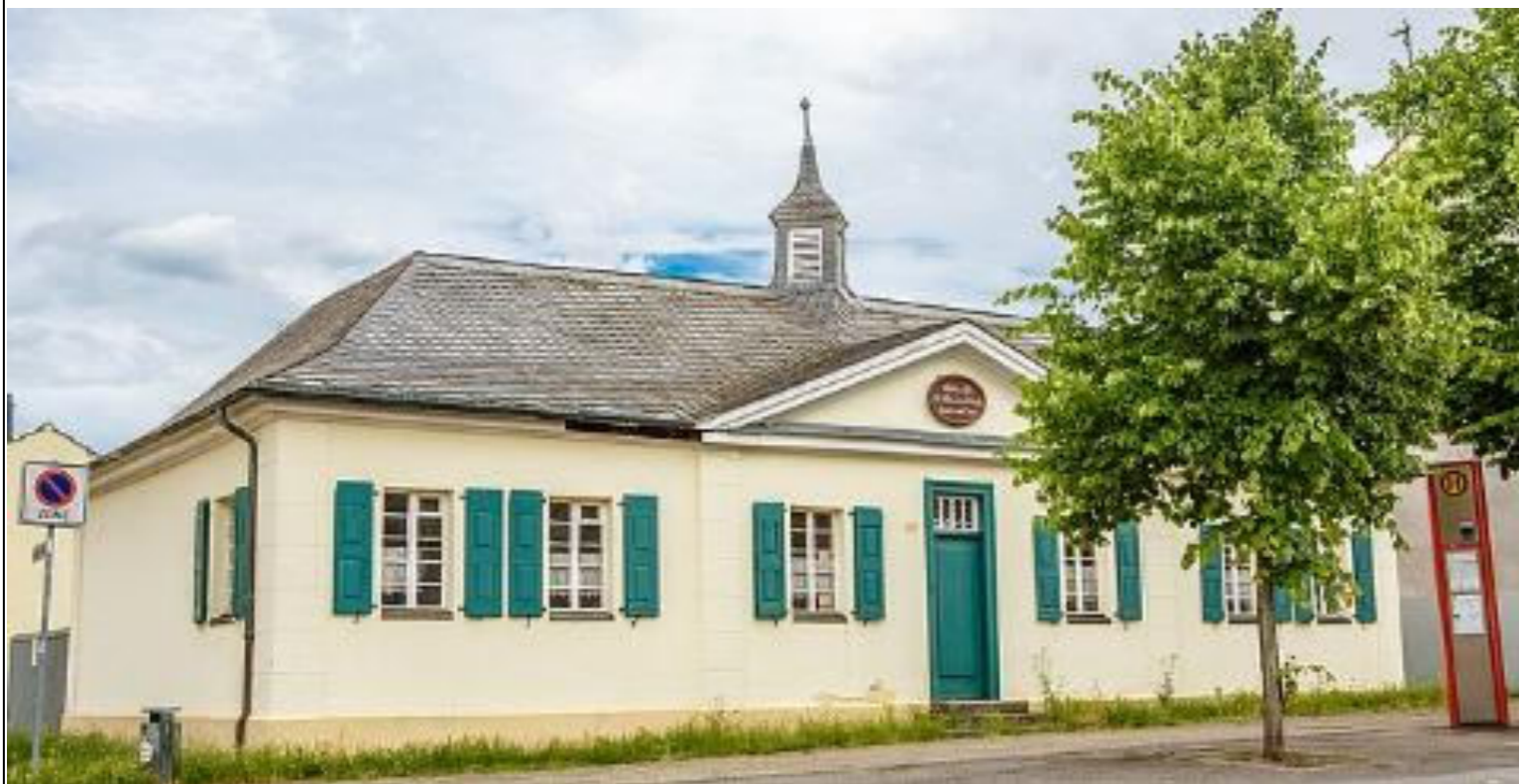
Alte Schule Delhoven / Stara szkoła Delhoven