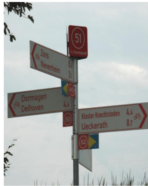
Wegweiser für Fahrradtouren/ Drogowskaz dla wycieczek rowerowych