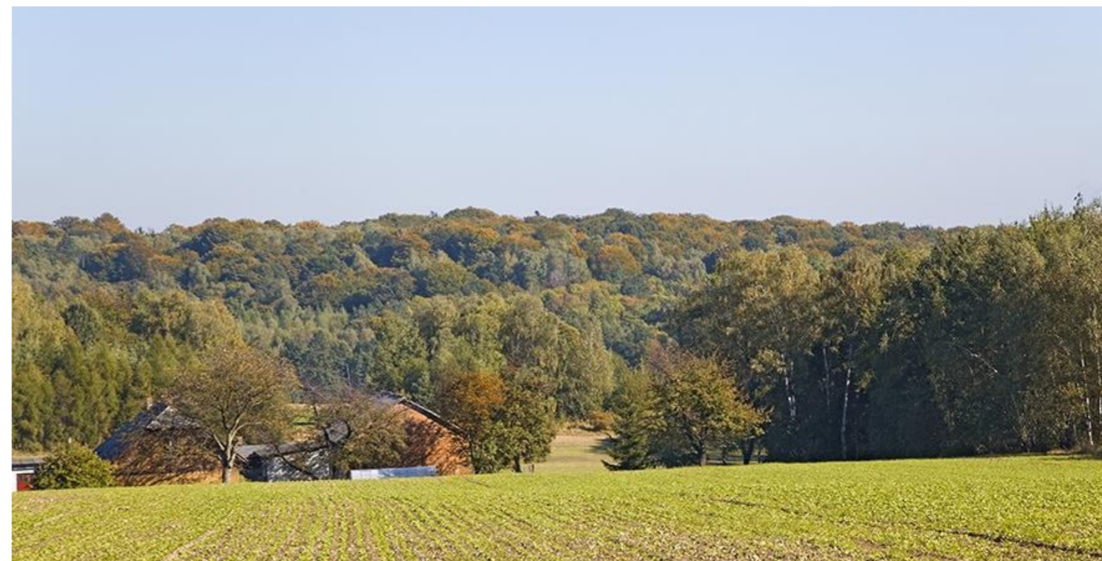
Widok na Górkę św. Wawrzyńca w Orzeszu / Blick auf den Heiligen Laurentius Hügel in Orzesze